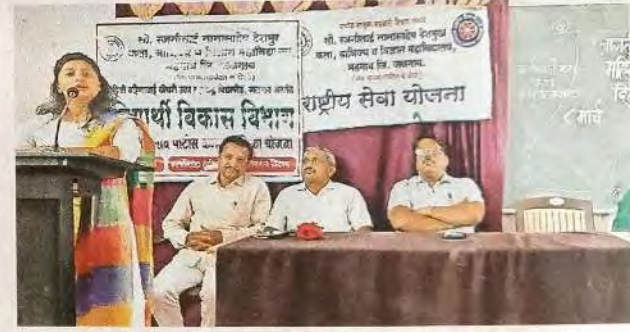
देशमुख महाविद्यालयात महिला दिनानिमित्त कायदेविषयक मार्गदर्शन.