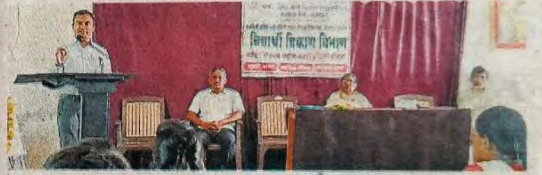
देशमुख महाविद्यालयात आयोजित शिबिरात सहभागी मान्यवर.