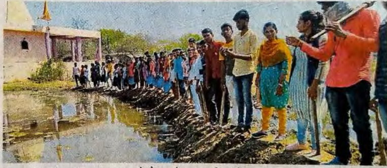
वडगाव (ता. भडगाव) : श्रमदानातून बांधलेल्या बंधान्यासह विद्यार्थी.