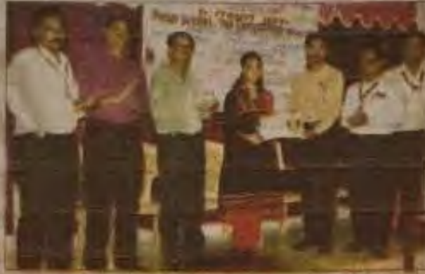
पोस्टर प्रदर्शन स्पर्धेत वडील सी.रकनीतार्ये सनासाहेब देशमुख कला, वाणिज्य व विज्ञान महाविद्यालयात रसायनशास्त्र विभागाच्या वतीने आयोजित पोस्टर प्रदर्शन स्पर्धेत ४० विद्यार्थ्यांनी पोस्टरद्वारे सादरीकरण केले.

वेदील सी.रकनीतार्ये सनासाहेब देशमुख कला, वाणिज्य व विज्ञान महाविद्यालयात रसायनशास्त्र विभागाच्या वतीने जिस्त्यास्तरीय पोस्टर प्रदर्शन स्पर्धा आयोजित करण्यात आली होती. जागतिक तापमान वाढीचे परिणाम, कारखान्यातून निघणाऱ्या दुर्भिक्ष प्रदूषकांचे व्यवस्थापन, अन्न भंडार व त्याचे परिणाम या विषयांवर आधारित ४० विद्यार्थ्यांनी पोस्टरद्वारे सादरीकरण केले.