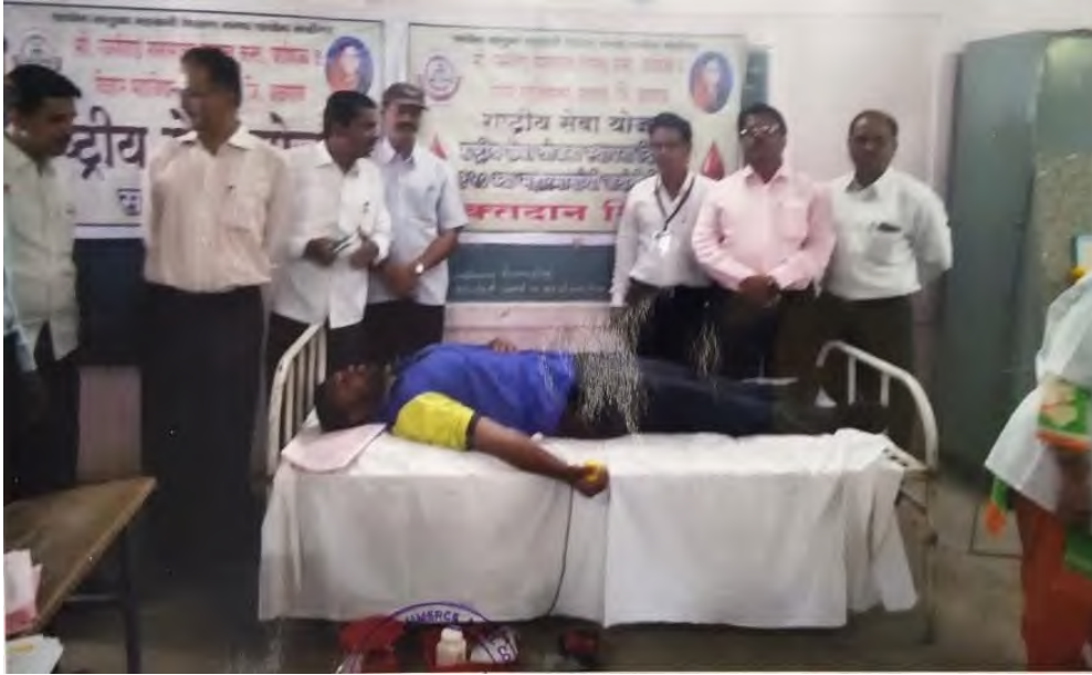
Blood Donation Camp date: 28.09.2018