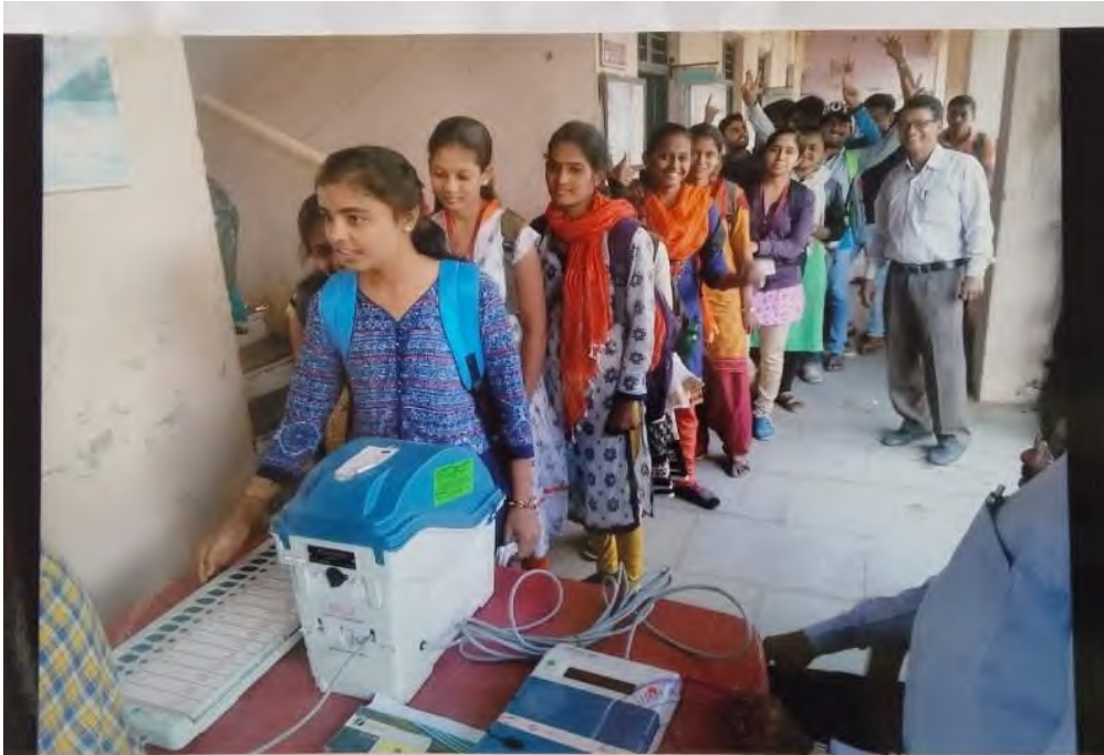
Hands on Training of EVM and VVPAT date 07.03.2019