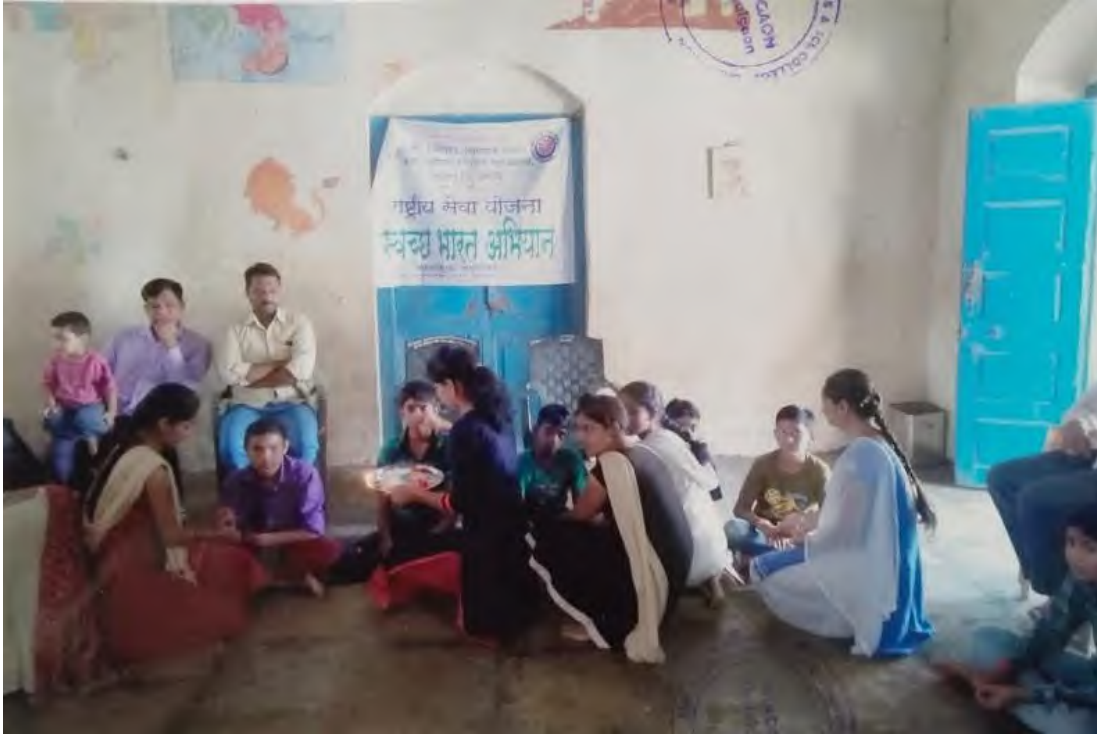
Raksha Bandhan at Remand Home Wak Ta- Bhadgaon Dist- Jalgaon 01.08.2018