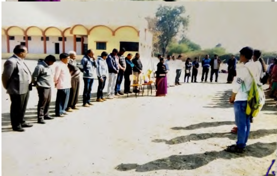
Hutatma din (Martyr Day) date 30.01.2019