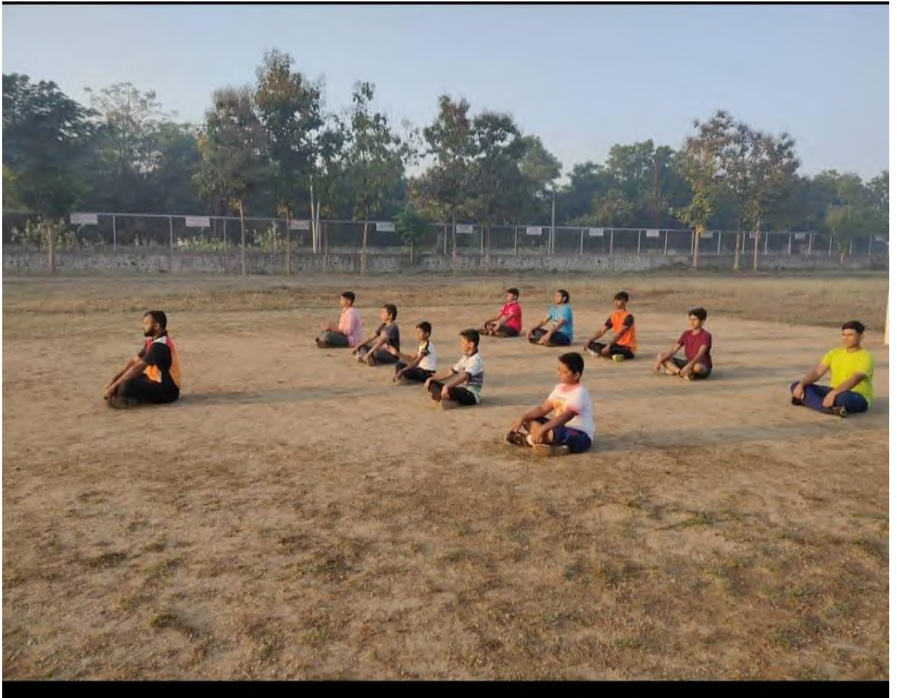
International Yoga Day Celebration date 21.06.2018