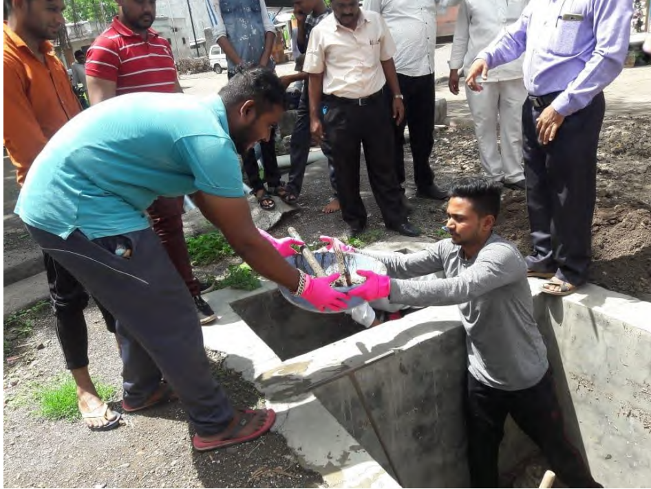
100 hours Swachh Bharat Mission cleaning of roads at adopted village Bodarde date 30.06.2018