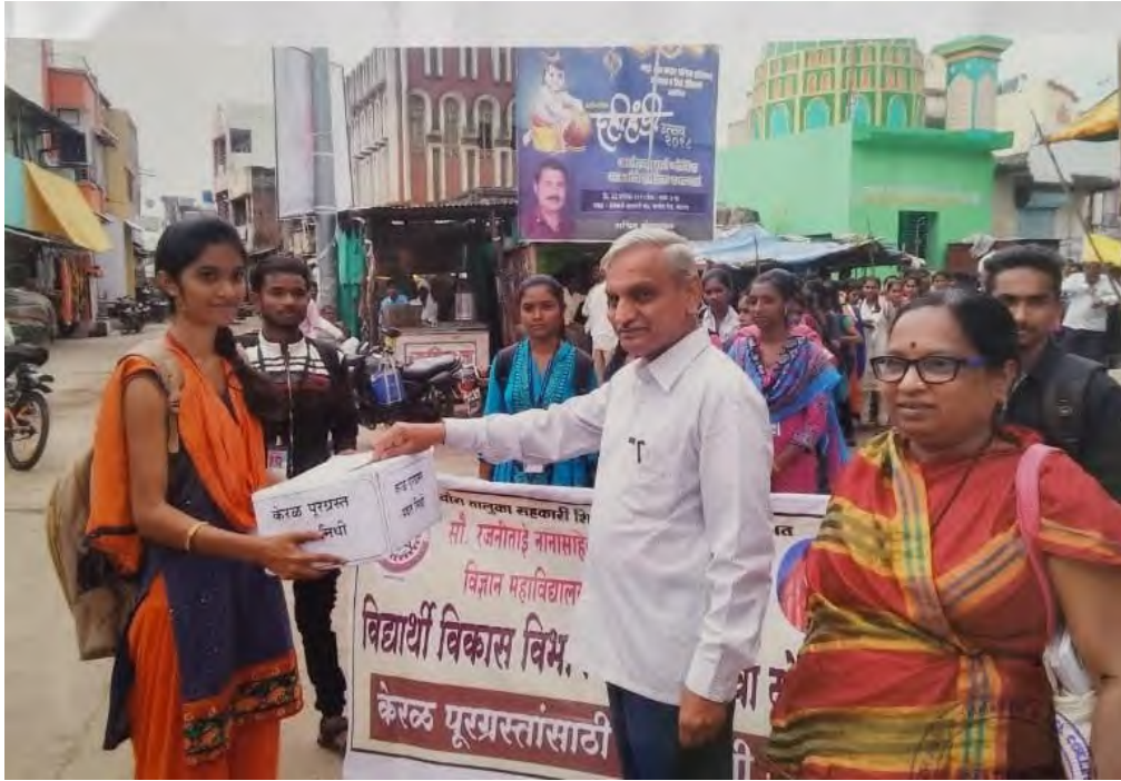
The civilian sharing in the relief fund during rally for Kerala Flood victims date 04.09.2018