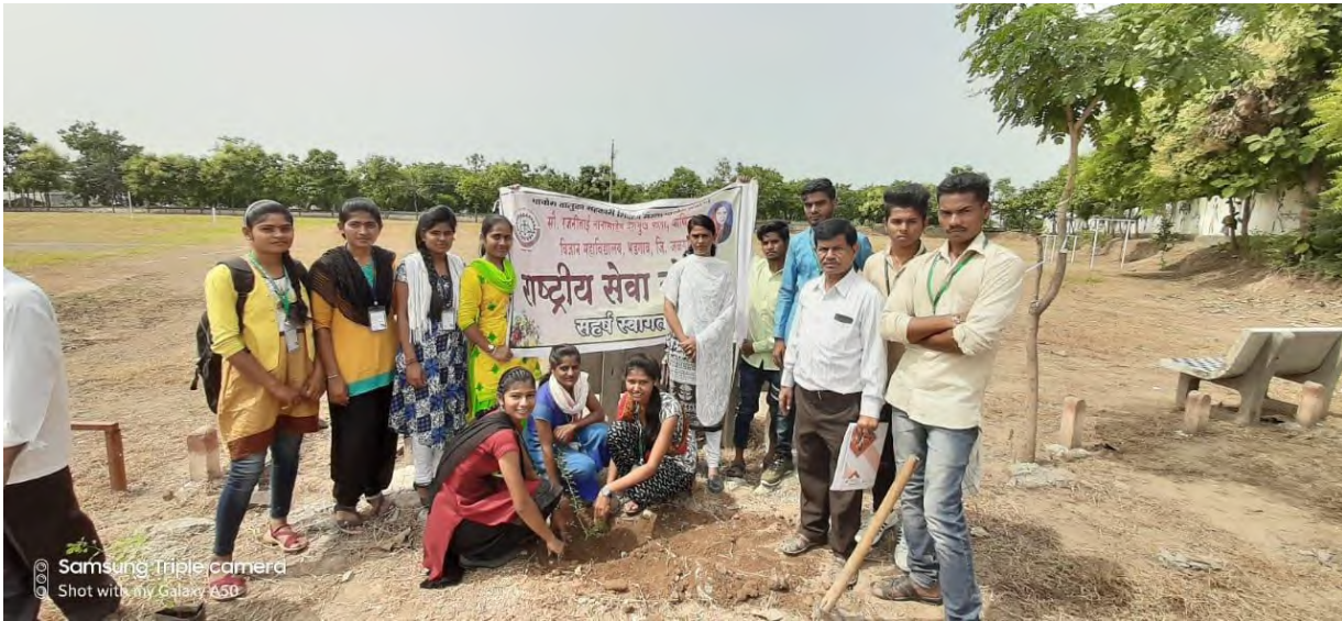
Tree Plantation by NSS Volunteers date 24.07.2019