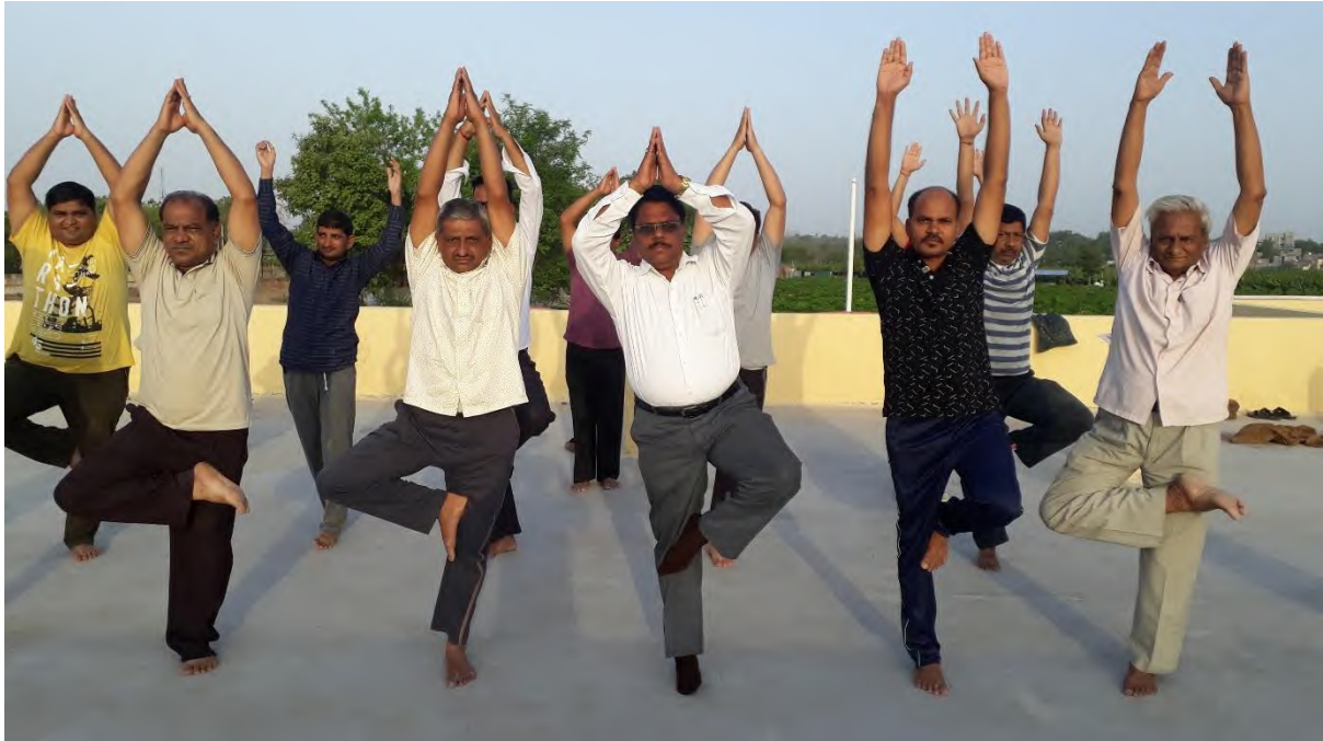
International Yoga day. date 21.06.2019