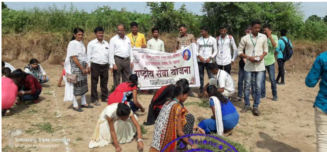
Cleaning campus our volunteers under the Swachh Bharat Abhiyan date: 07.08.2019