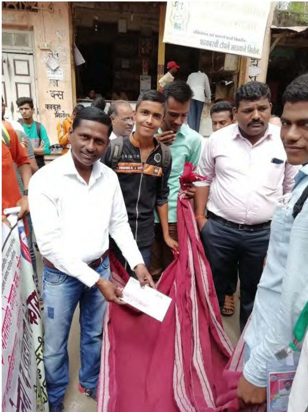
Photographs of Rally of Relief Fund West Maharashtra Flood Victim Date: 16.08.2019