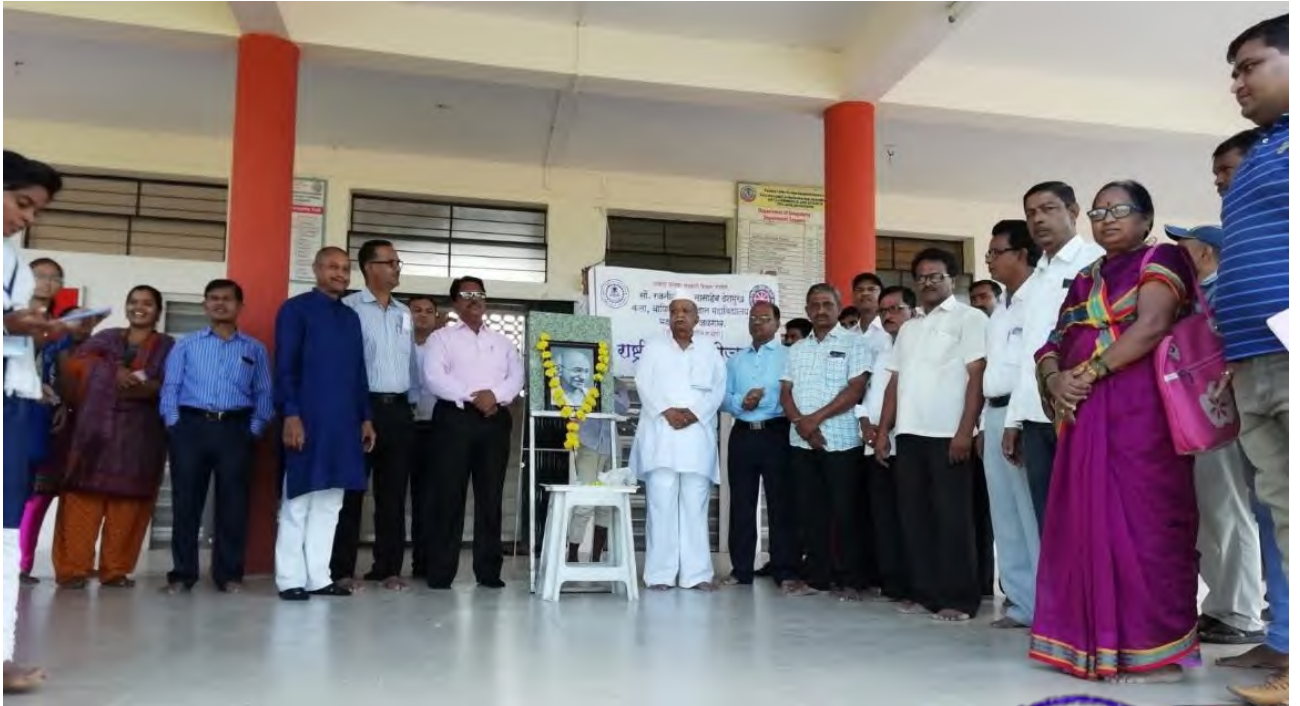
Photograph of Mahatma Gandhi Jayanti Date: 02.10.2019