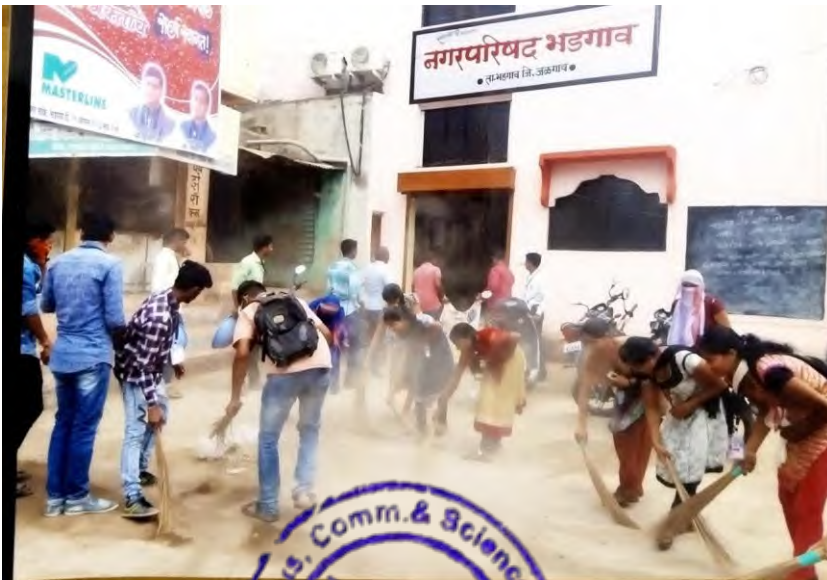
Swachh Bharat Abhiyan campus cleaning at M.C. Bhadgaon Date 07.08.2019