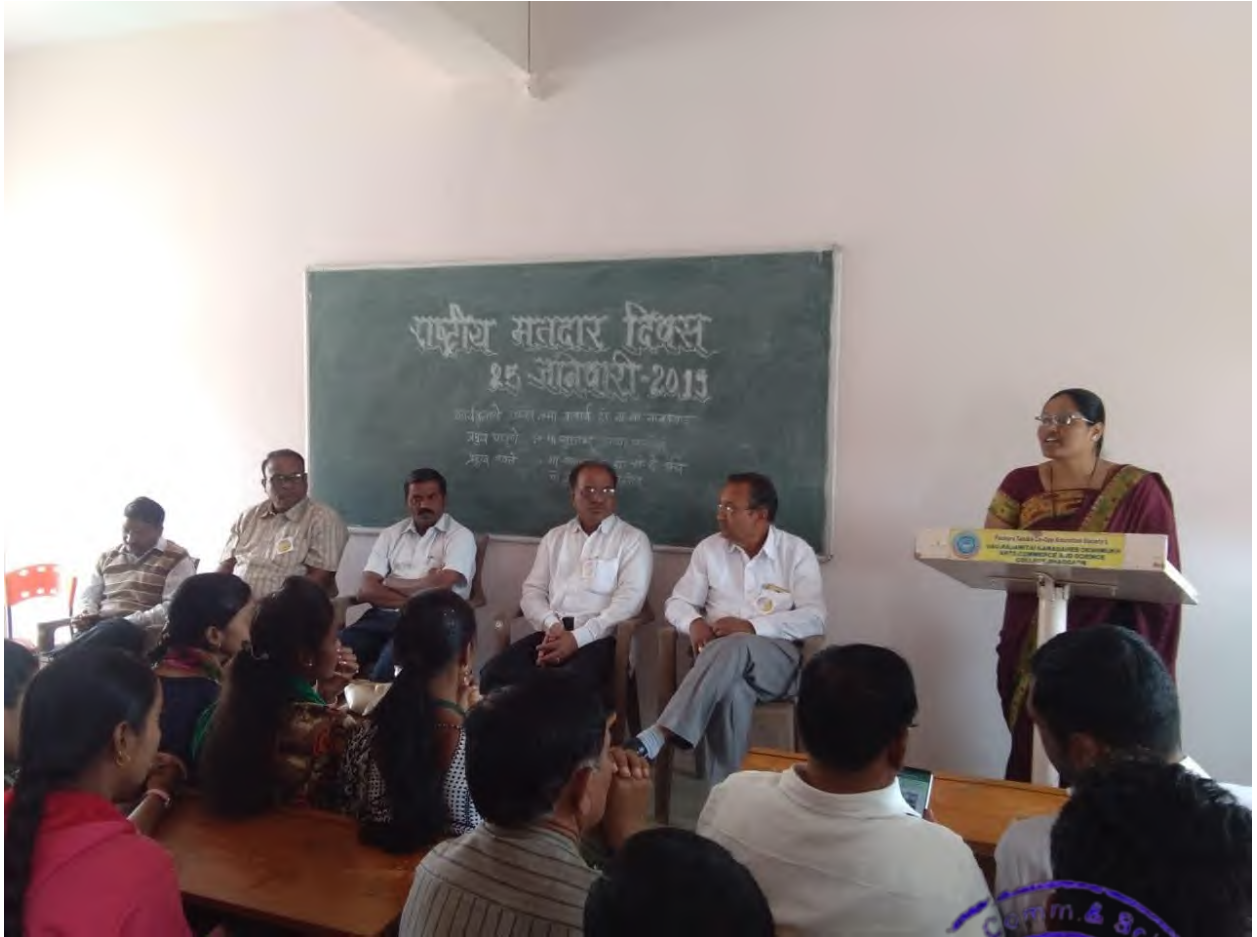
National Voter Day Date: 25.01.2019