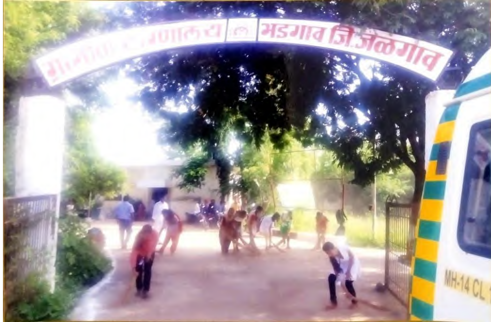
Swachh Bharat Abhiyan campus cleaning at Government Rural Hospital Bhadgaon