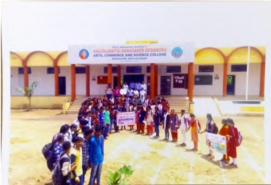
Aids awareness Program date: 15.08.2019