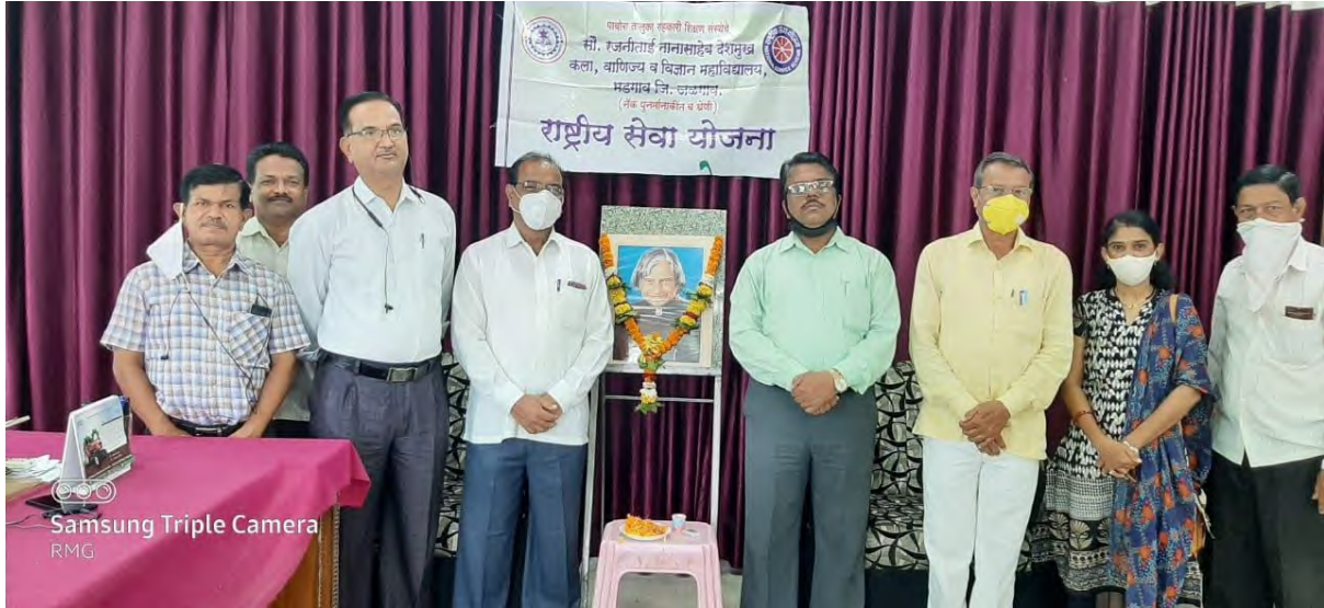
Celebration of Wachan Prerana Divas date: 15.10.2020